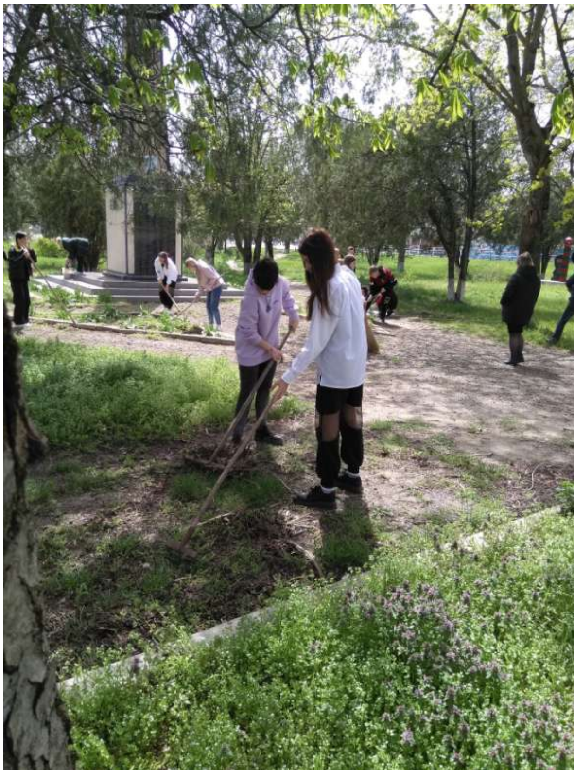
Уборка территории от веток и листвы