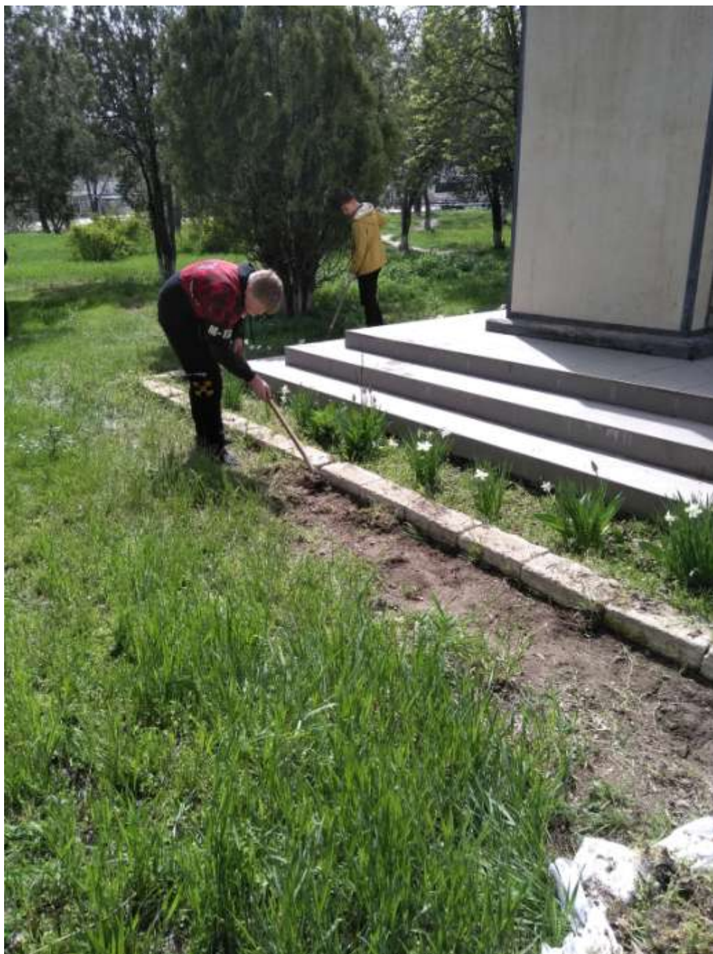
Удаление сорняков и поросли