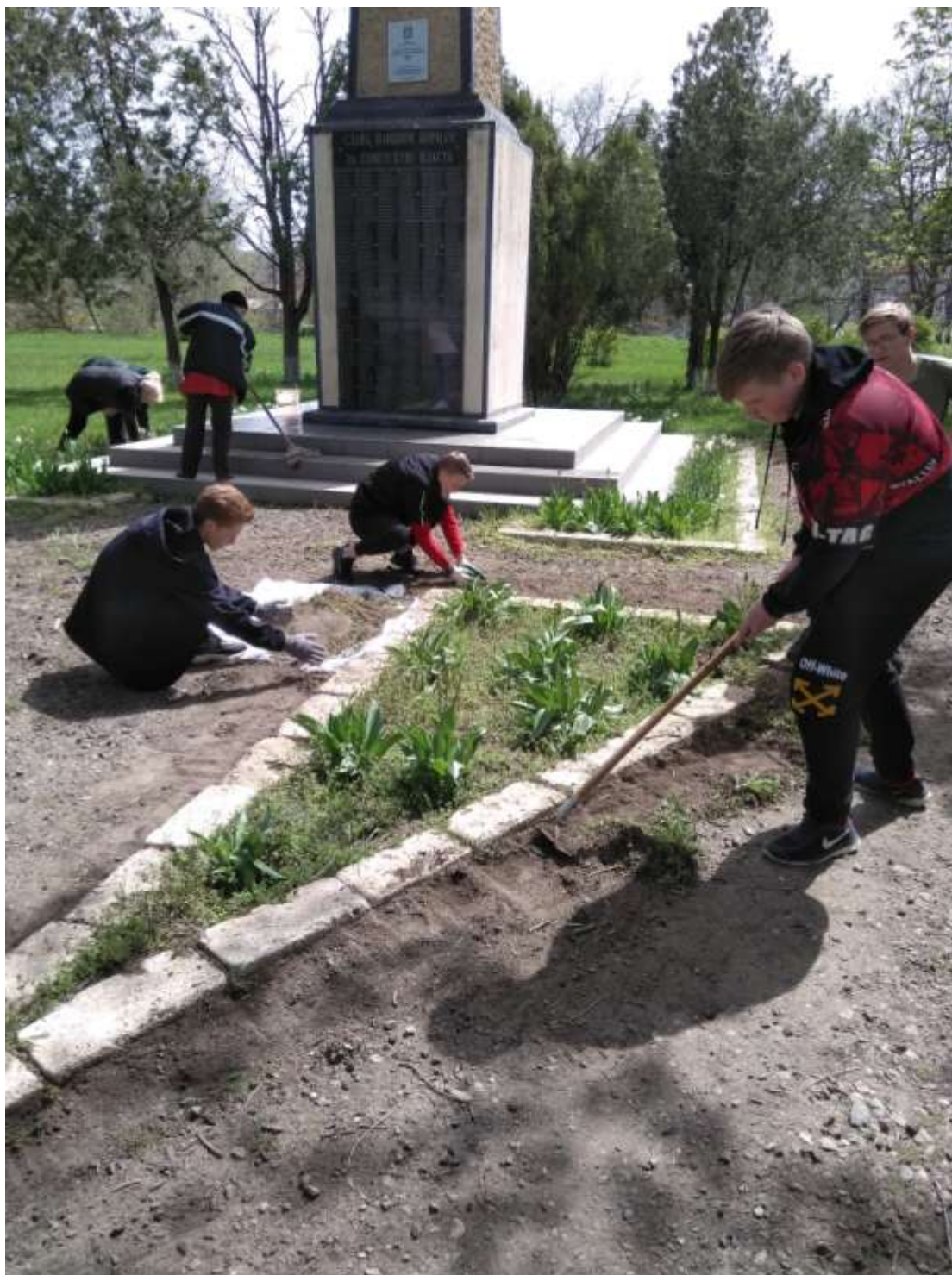
Облагораживане клумб, уборка мусора