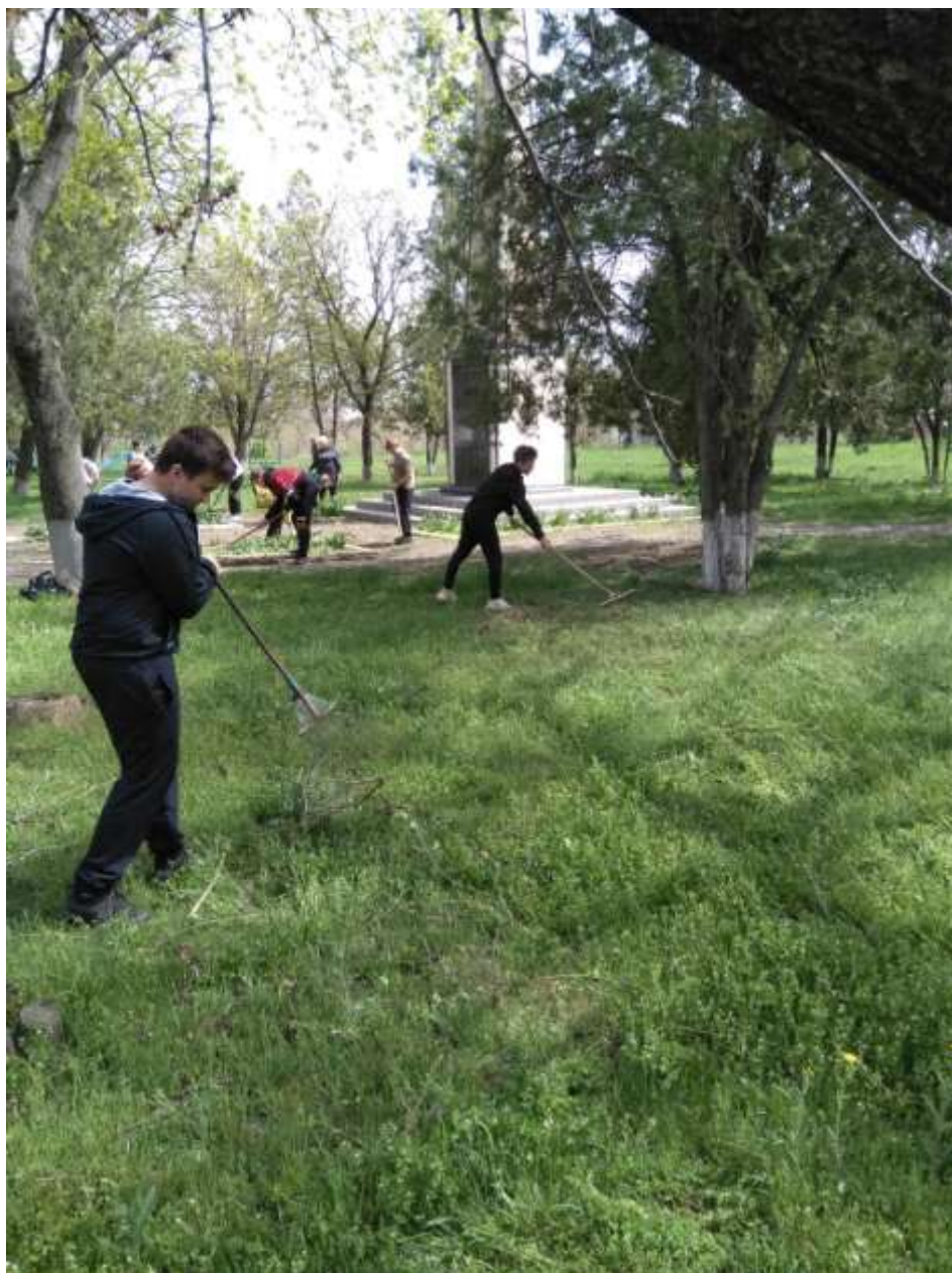
Уборка сухой листвы и веток на близлежащей территории